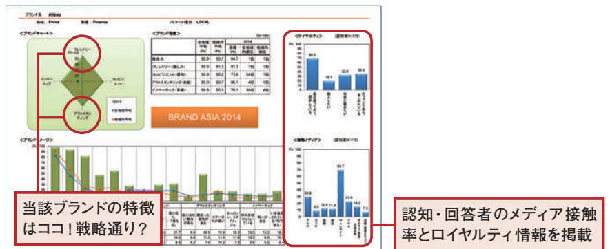
個別分析シート(データCD-ROM出力見本)